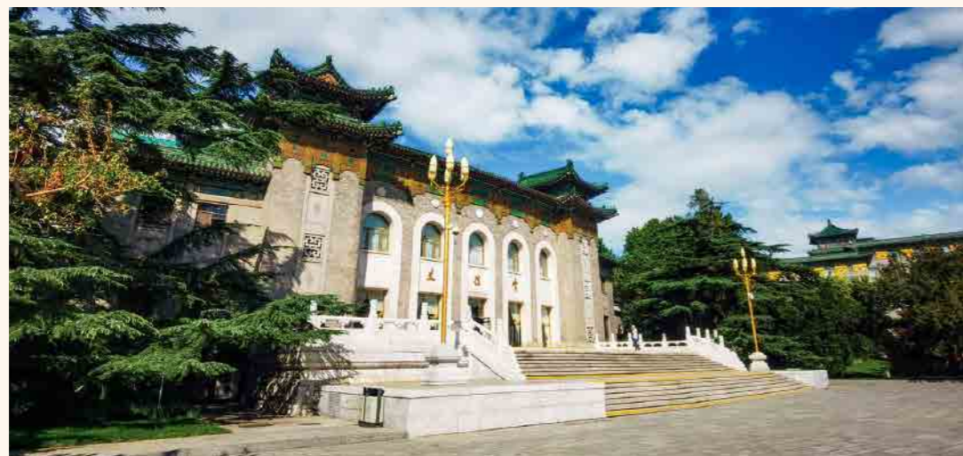
主办单位： 南开大学 nature conference

会议时间： 2024年9月23-25日 布展时间： 2024年9月22日 展览时间： 2024年9月23-25日 撤展时间： 2024年9月25日下午 会议地点： 北京友谊宾馆 会议地址： 中关村南街1号